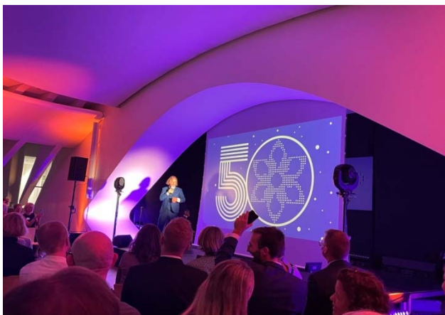
50周年庆祝活动现场

8月29日这一天，我们有幸见证我们的瑞士合作伙伴Hepp Wenger Ryffel AG迎来其辉煌的50周年纪念。此刻，他们正在瑞士维尔举办一系列精彩活动，以此庆祝这一具有里程碑意义的时刻。