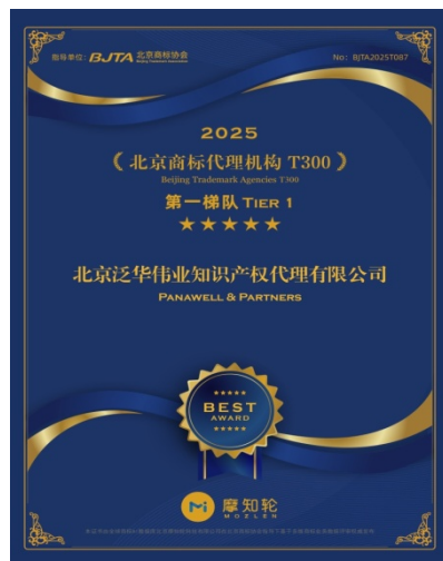
北京商标代理机构T300第一梯队荣誉证书