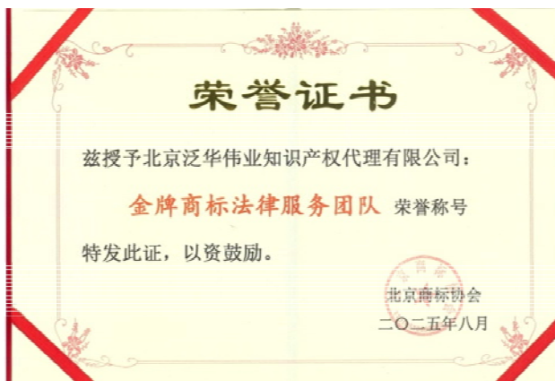
金牌商标法律服务团队荣誉证书